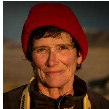
Isabelle AUTISSIER Marraine des United Ladies 2021

« A toutes celles qui souffrent à travers le monde d'un cancer du sein et de ses suites, j'adresse un salut amical et fraternel; Les désastres environnementaux sont l'une des raisons de l'accroissement des cancers. Mais se reconnecter à la nature, respirer un moment loin de nos bureaux, nos ordinateurs et nos portables est une formidable occasion de revivre et de retrouver ensemble les joies de l'air pur, de l'eau pure et de la vie des bêtes et des plantes. Profitez toutes de cette belle expérience, renouvez-vous là et faites-la partager. »